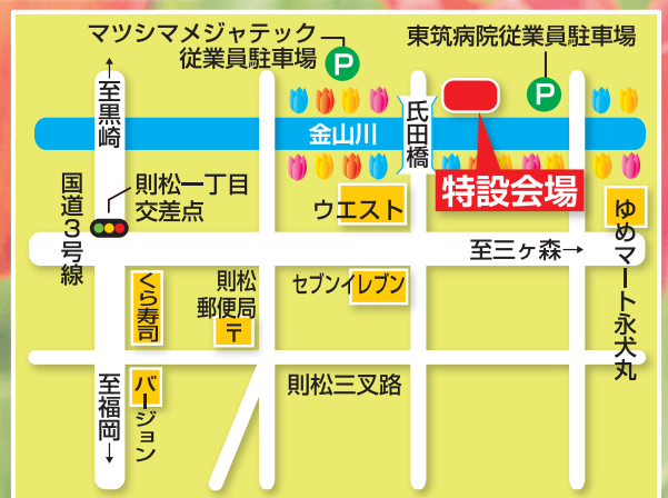
八幡西区則松6・3~4付近 (氏田橋付近特設会場)

★まつり当日のみ、「マツシマメジャテック従業員」と「東筑病院従業員」のP駐車場が無料でご利用いただけます。