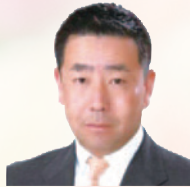
NPO則松金山川コスモス会代表理事

則松金山川コスモス会では、ボランティアによる花の金山川公園づくりをめざしています。手づくりの心、ふれあいの心、それは住んでる人が自ら汗を出し花をつくることで健康づくりにつながり、楽しさを味わっています。昨年11月中旬より年末にかけて27種類のチューリップ10万球をボランティアの皆さんと植えました。今年は4月8日(日)に「則松金山川チューリップまつり」を行います。お祭りのバザーや出し物もすべて手づくりであります。是非お出かけいただき、春のひとときをお過ごし下さい。